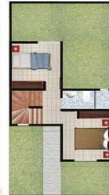
CASA TIPO A - PISO 2