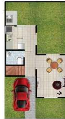
CASA TIPO A - PISO 1