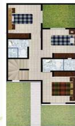
CASA TIPO B - PISO 2