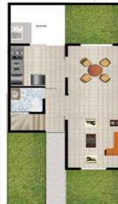
CASA TIPO B - PISO 1